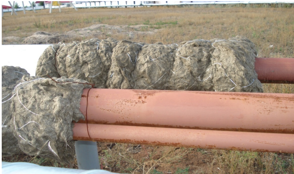
Рис.1. – Усадка минеральной ваты

Для указанных теплоизоляционных материалов трубопроводов, недостатками является низкая термостойкость при высоких температурах (для пенополиуретана, пенополиэтилена и других вспененных полимерных теплоизоляционных материалов), а также увлажнение и повышенная усадка (для минераловатных изделий (см. рис.1)), с последующей потерей ими теплозащитных свойств.