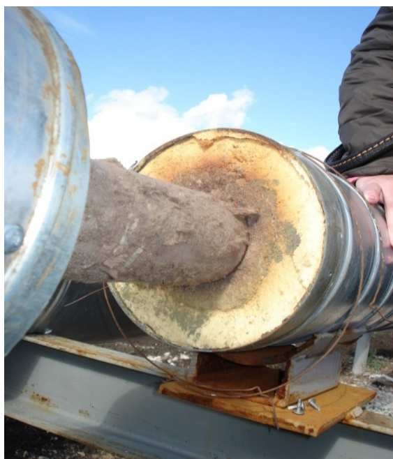
Рис. 2. – Торец двухслойной тепловой изоляции (базальт + пенополиуретан)

В работах А.Г. Дементьева установлено, что долговечность ППУ-изоляции зависит от температурной среды, в которой она работает. Приводятся графики (см. рис. 3) зависимости коэффициента теплопроводности от длительного теплового старения [10].