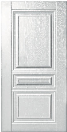
243 Альберо браш серебро (16 мм)