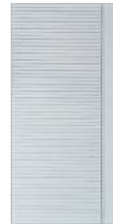
757 Рикамо софт милк (10 мм)