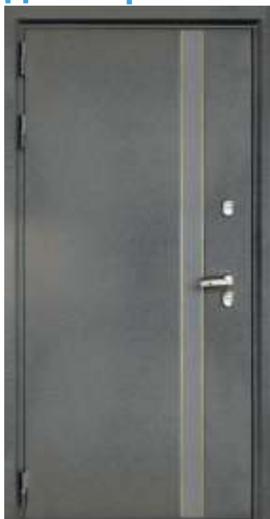
Металл с молдингами. Цвет: «Антик серый неон».