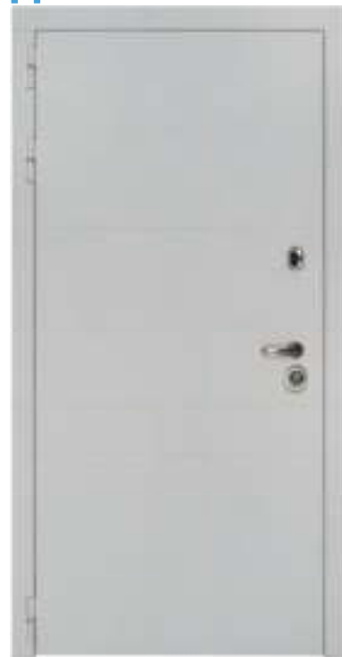
Панель МДФ: 10 мм. Цвет: «Софт белый снег».