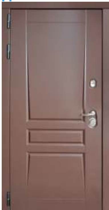
Панель МДФ: 16 мм. Цвет: «Шоколад».