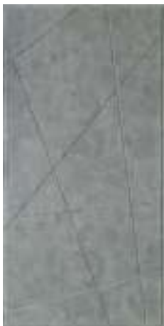
655 Лофт бетон грей (10 мм)