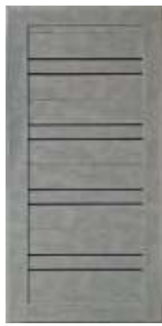
49 Бетон серый (16 мм)