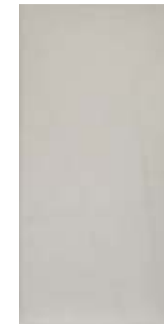
655 Лофт капучино (10 мм)