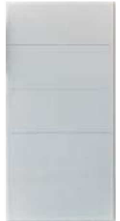
649 Софт белый снег (10 мм)