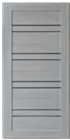
49 Сосна прованс (16 мм)