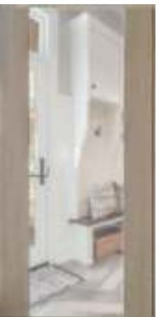
2 Лиственница (16 мм)