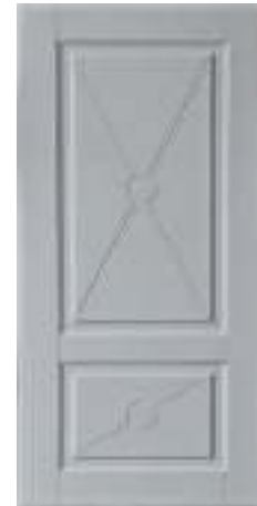
617 Рикамо софт милк (10 мм)