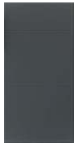
649 Софт графит абсолют (10 мм)