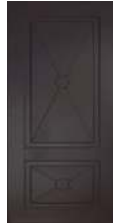
617 Ясень шоколад (10 мм)