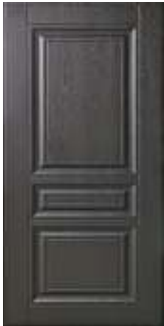
243 Фактурный шоколад (16 мм)