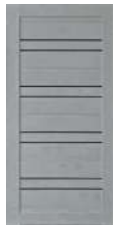
49 Бетон снежный (16 мм)