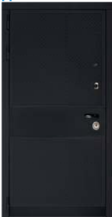
Панель МДФ: 16 мм. Цвет: «Софт графит».