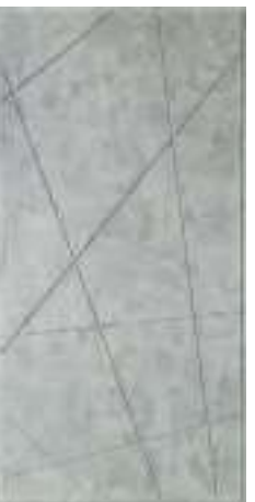
655 Бетон натуральный (10 мм)