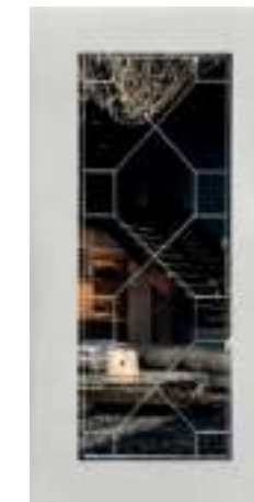
Тифани зеркало секвойя (10 мм)