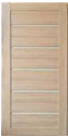
46 Лиственница (16 мм)