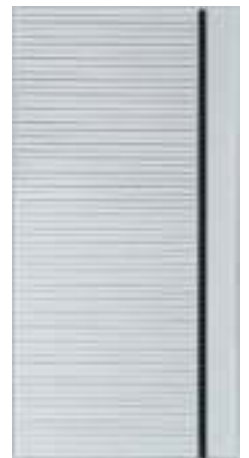
757 Рикамо софт чер.стекл.(10 мм)