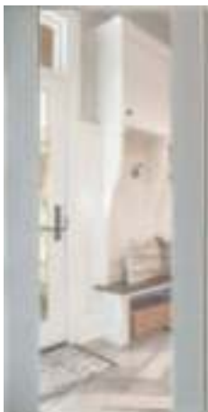
1 Софт белый (16 мм)